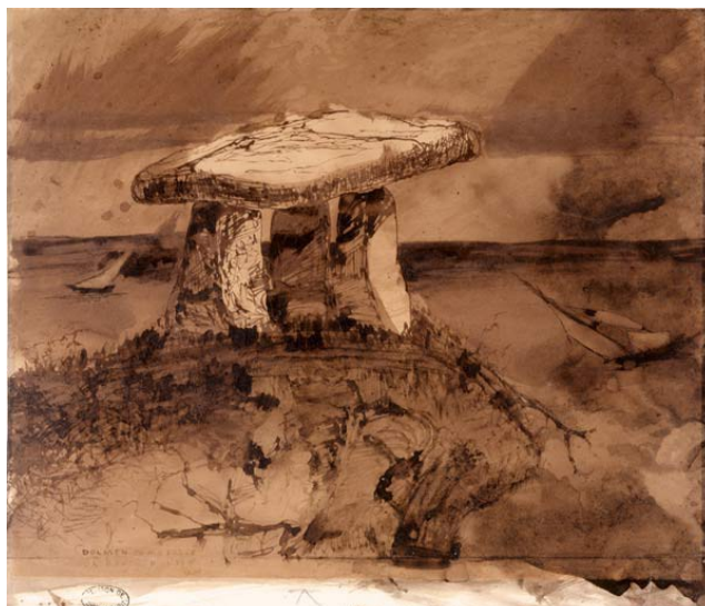
Dolmen où m'a parlé la bouche d'ombre

Plume et pinceau, encre brune et lavis, fusain, zones frottées sur papier beige.