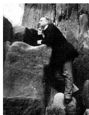
Hugo pendant son exil à Jersey (vers 1853-1855)

Maison Vacquerie-Musée Victor Hugo, Villequier