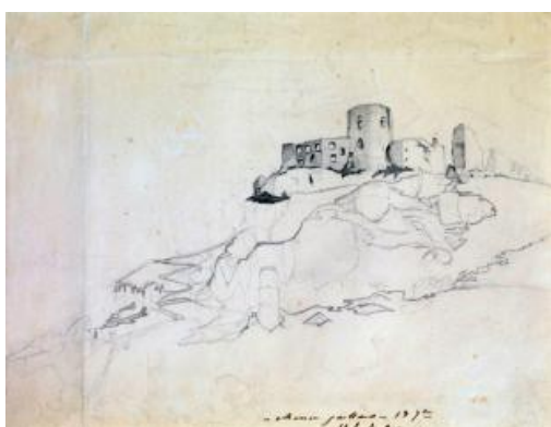
Hugo, Château Gaillard, dessin

Un exemple ici avec le Château Gaillard qui se trouve aux Andelys.