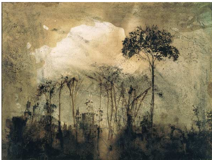
Château dans les arbres

intérieur que nous nommons la rêverie ; j'avais l'œil tourné et ouvert au-dessus de moi, et je ne voyais plus la nature, je voyais mon esprit" (Voyage dans les Pyrénées).